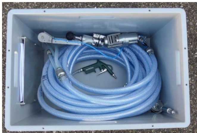
Kiste gross L x B x H : 600 x 400 x 440