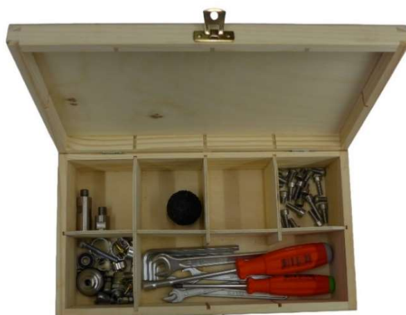
Werkzeug + Zubehör