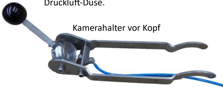
Kamerahalter vor Kopf