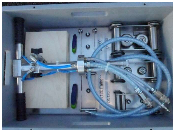
Kiste klein L x B x H : 600 x 400 x 240