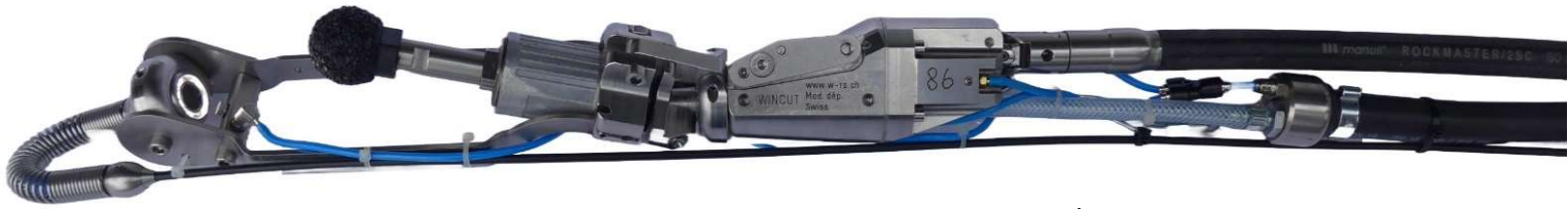
Der WINCUT ohne Erweiterungssatz für Rohr DN80/DN100