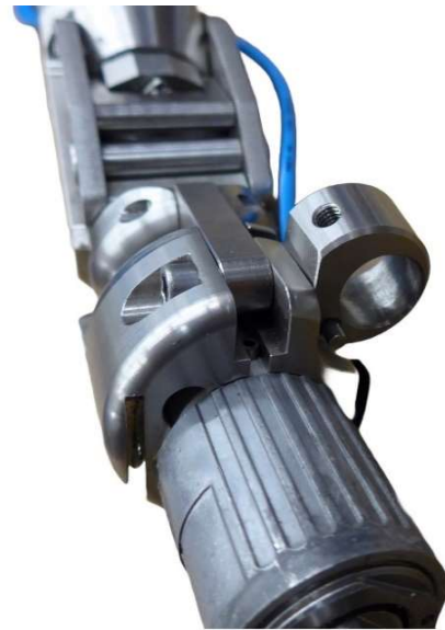
Kamerahalter über Motor